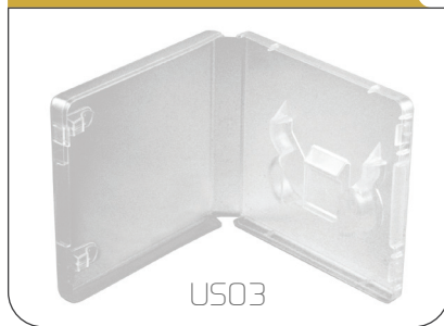
USB Box in plastica trasparente