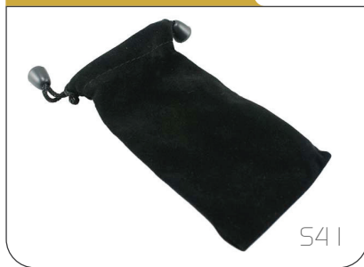
Pouch in velluto nero