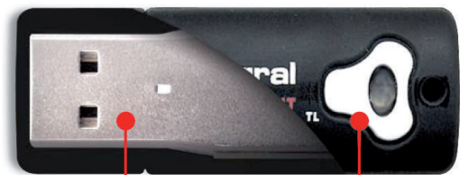
Telaio interno in acciaio